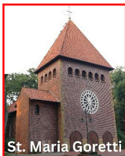
St. Maria Goretti